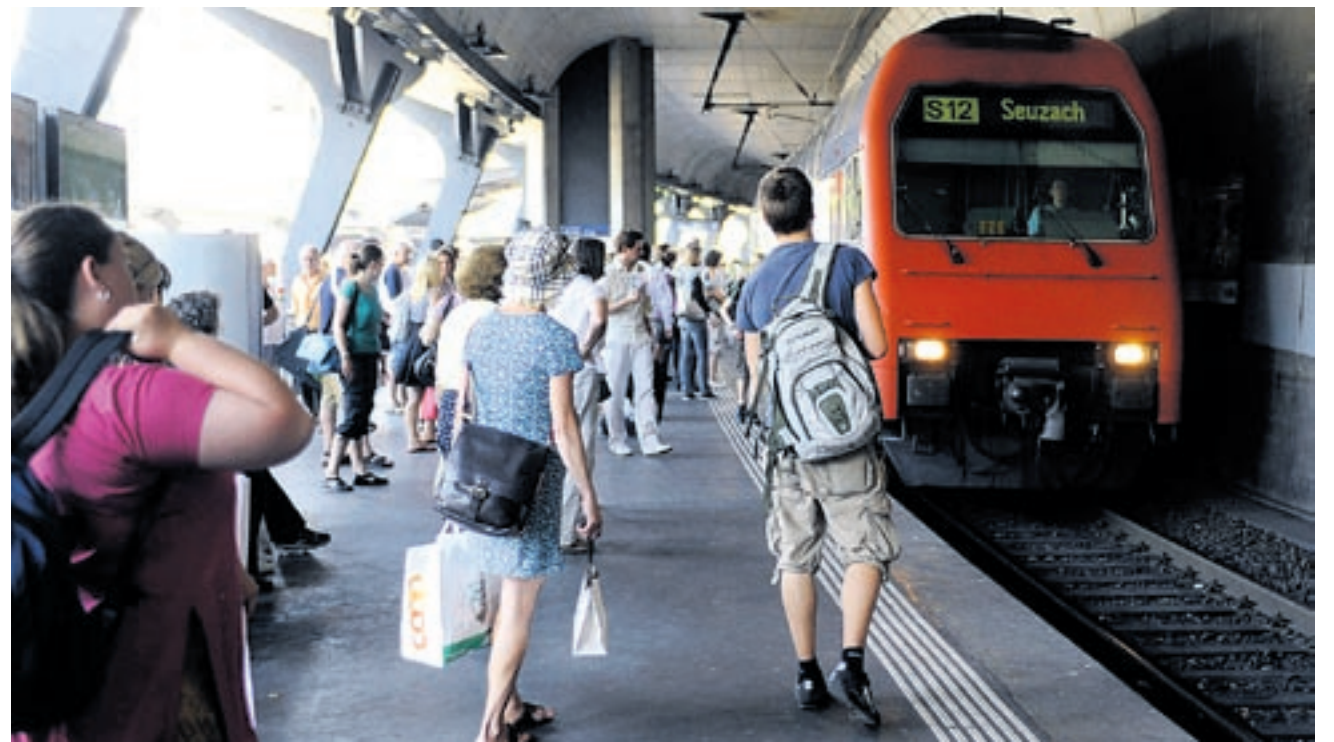
Soll die Fahrt zwischen Stadelhofen (Bild) und Winterthur vor allem im Tunnel stattfinden oder oberirdisch?